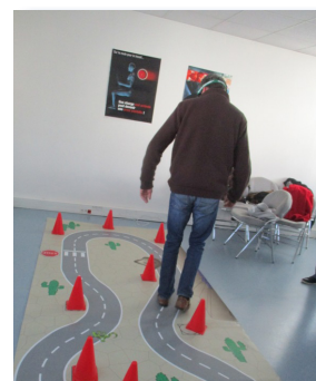
Atelier prévention alcool avec tapis et lunettes de simulation

Le risque lié aux addictions en entreprise, est un sujet complexe qui demeure encore sensible. Ces sensibilisations libèrent la parole et s'inscrivent, dans une démarche de prévention.