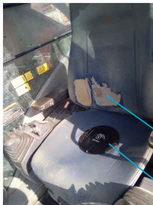
Siège de la pelle à chenilles

Ces prises de mesure étaient demandées pour, dans les deux cas, l'amélioration des conditions de travail dans le but d'un changement de siège des conducteurs souffrant de troubles musculo-lombaires .